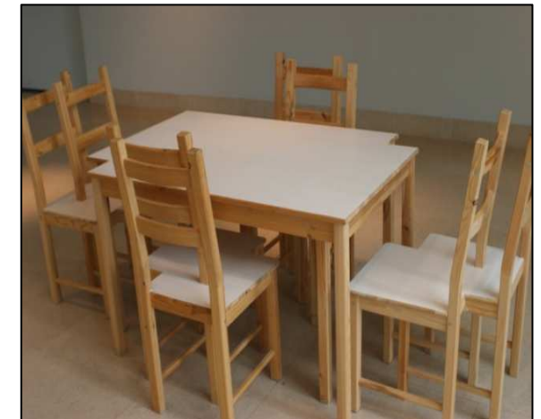
Illustration : « Table de réunion » - Th. Mouille - 2004 - Musée des Beaux Arts de Nancy

Psychologue clinicien Une invention, un devenir